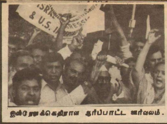
இஸ்ரேலுக்கெதிரான சூர்ப்பாட்ட ஊர்வலம்.

ஜோர்டானிய சுயாட்சியின் கீழ் கொண்டு வந்தால் அங்குள்ள 15 லட்சம் பாலஸ்தீனிய அகதிகளுக்கு வாழ்வளிக்கலாம் என்ற வகையில் PLO, முபாரக்குடனும், குசேடனும் சுயாட்சி பற்றிக் கலந்தாலோசித்தனர். இதனை ஸ்ரேலிய தொழிற் கட்சி ஆதரித்தாலும், ஸ்ரே