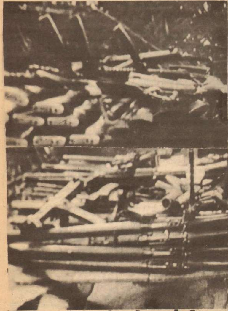
சாவகச்சேரி போலீஸில் சிவையத்திலே ரிஜிஸ்டரேஷனுக்குக் காரால் அகப்பட்ட பட்டினி. கலிசாரக் சிபுதங்கனில் ஒரு பட்டினி.

* அராஜா இந்தியா மீது கண்டனம். முதன் முறையாக, அனுராதபுரநாயக்கா பாராளுமன்றத்தில் இந்தியாவைக் கண்டித்து உள்ளார். 27-11-84 அன்று தமிழ் நாட்டில் தமிழ் தீவிரவாதிகளின் பயிற்சி முகாம்கள் உள்ளன எனும் செய்தியை இந்தியா மறுத்ததற்காகக் இந்தியாவைக் கண்டித்தார். இந்தியாவுடன் சிறப்பான உறவை இலங்கை வைத்திருக்காமல்கு இலங்கையரசைக் குறை கூறினார். இனப்பிரச்சினையைத் தீர்ப்பதில் இந்தியாவின் பங்கும் தேவையென அவர் மேலும் கூறினார்.