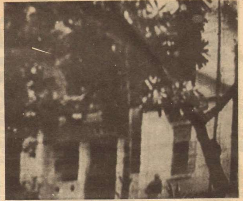
சாவகச்சேரி, ரிபலிஸ் நிழையம் சூன்பக்கத் தோற்றம்.

என்றும் எமது இலட்சிய வேலையின் இடைவேளைகளில் தலைக் கவசம், துப்பாக்கி, தானாகப் பணியும் தியாக தீரர்கட்கு அஞ்சலி செய்யும்!