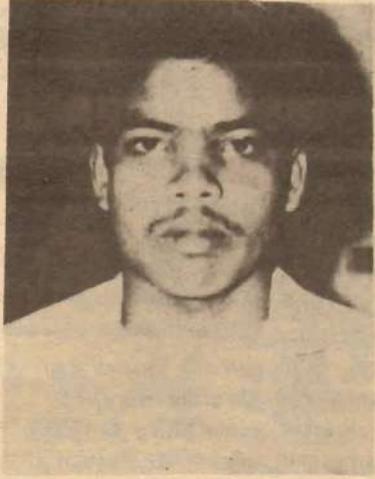
மரணத்தைச் சூடியதால் மனத்தின் மன்னர்களான வீரர்களே! திரிகள் மறைந்தும் நீங்கள் தீபங்களே!!

தோழர் திக்கலஸ் [சாவகச்சேரிச் சமரில் உயிர் நீத்தவர்]