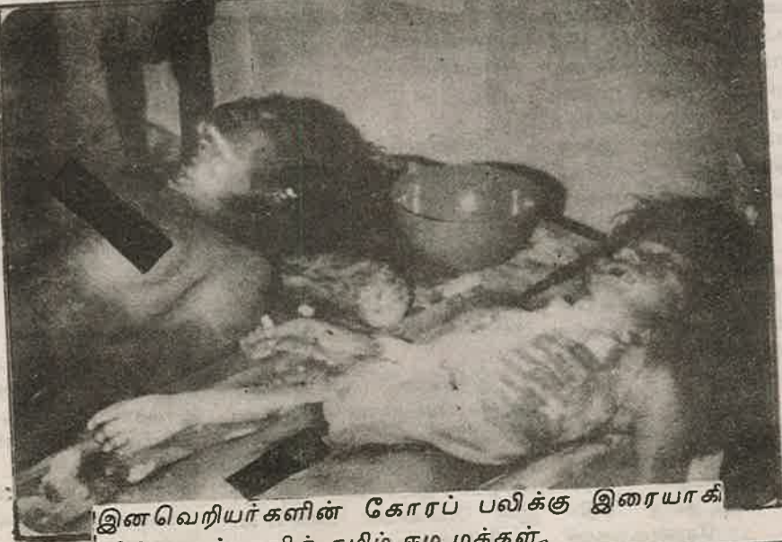
இனவெறியர்களின் கோரப் பலிக்கு இரையாகி விட்ட அப்பாவித் தமிழ் சூழ் மக்கள்.

இவ் வதிரடிப்படையுக்கு இங்கிலாந்து செனாய் தீவுகளை சேர்ந்த தனியார் நிறுவனமான கே.எம்.எஸ் என்ற கம்பனியே பயிற்சி அளித்து வருகின்றது. இந்நிறுவனமே பெய்ரூத் இலுள்ள இங்கிலாந்து தூதரக அதிகாரிகளுக்கு மெய்க் காவலர்களாக இருக்கிறார்கள் என்றும் "ஓப்சேவர்" பத்திரிகை தெரிவித்துள்ளது.