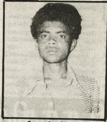
தோழர் : சோபு