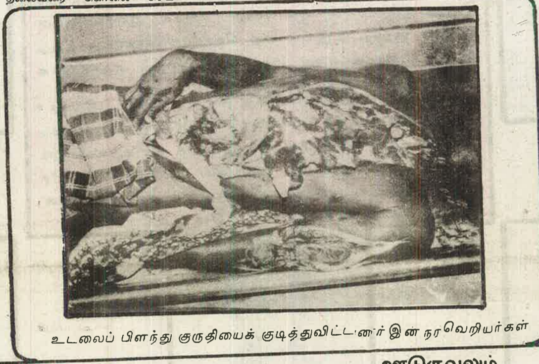
உடலைப் பிளந்து குருதியைக் குடித்துவிட்டனர் இன நரவெறியர்கள்

ஆப்கானிஸ்தான் புரட்சியை பாதுகாக்க, ஆப்கானிஸ்தான் மக்களின் விருப்பத்திற்கிணங்க ஆப் 11ம் பக்கம் பார்க்க